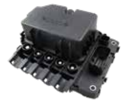
MODULI DISTRIBUZIONE POTENZA