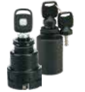
COMMUTATORI A CHIAVE