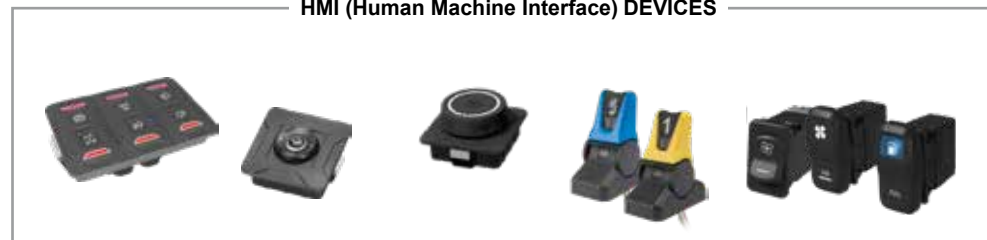
HMI (Human Machine Interface) DEVICES