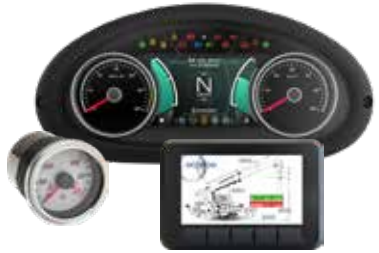
STRUMENTI E DISPLAY