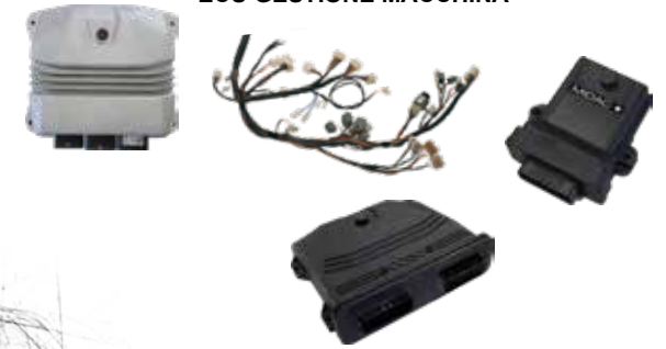
ECU GESTIONE MACCHINA