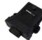
MODULI PER SISTEMI REMOTI