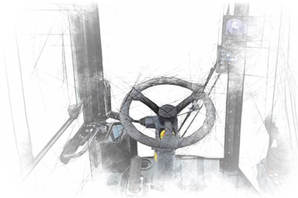
HMI (Human Machine Interface) DEVICES