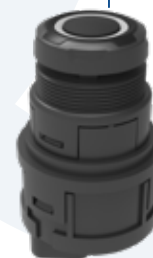
ECU ATTIVA Massima configurabilità