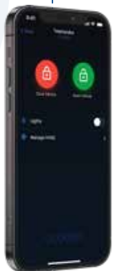
SMARTPHONE Key assistant