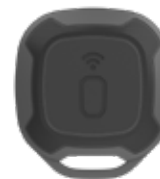
DUPLICATORE PASSIVO DI CHIAVI Piccola e portatile