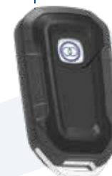
KEYFOB INTELLIGENTE Basso consumo