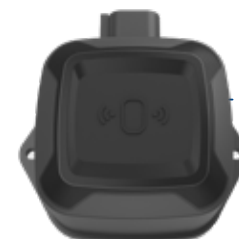
ESTENSORE DI SEGNALE Antenna attiva